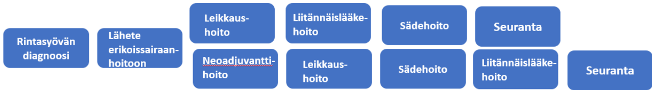
Kuva 1. Varhaisvaiheen rintasyöpäpotilaan hoitopolku yhä useammin alkaa neoadjuvanttihoidolla ja vasta sitten edetään leikkaukseen. Neoadjuvanttihoitoarvio edellyttää erikoissairaanhoidossa paksuneulabiopsioista hormonireseptori-, Ki67- ja HER2-värjäyksien määrittämistä hoitopolun valinnan mahdollistamiseksi.